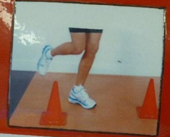
hinkelen (enkele sprongen)