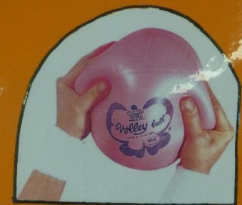
bal laten vallen-stuiteren en pakken